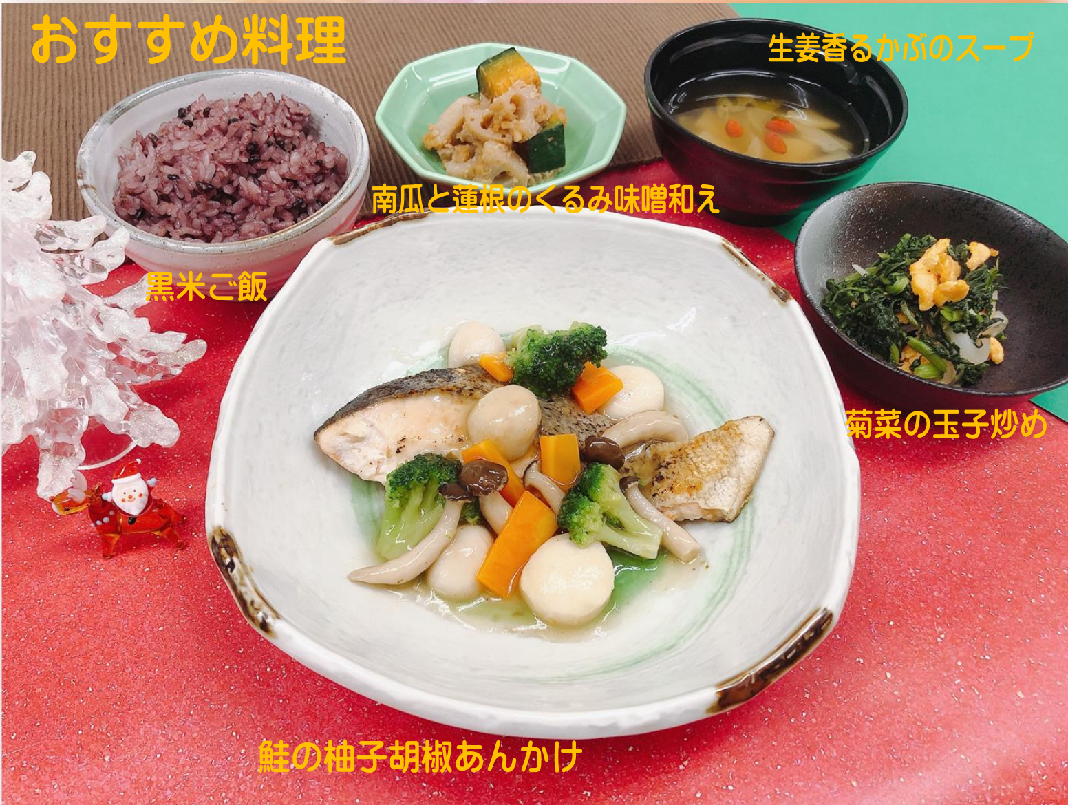
生姜香るかぶのスープ