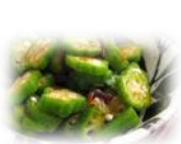
オクラのボン酢和え

ネバネバの元である糖タンパク質のムチンや食物繊維が豊富です。この粘りは胃の粘膜を保護したり潤滑物質としての役割があり、つるつとした食感が食べやすい夏野菜です。